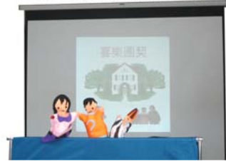
聖誕戲劇手偶示範教學

兩次的研習收穫很多，期許自己可以在接下來的教學中做足夠準備並應用出來，也期待之後可以再和各位老師和家長有進一步的分享並聽聽看大家不同的經驗與心得。